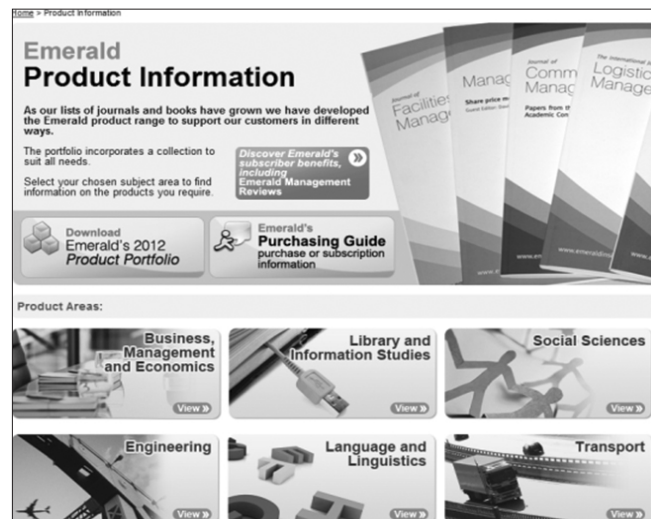
Obr. č. 1 Databáza EMERALD

Zatiaľ ako jediná vedecká knižnica na Slovensku ponúka svojim čitateľom prístup do databázy Emerald (obr. č. 1), ktorá obsahuje hodnotné plnotextové články časopisov zameraných na strojárstvo, manažment, ekonomiku, sociálne vedy a knižnično-informačnú vedu. Z viac ako 200 titulov periodík si určite každý vyberie a nájde informáciu potrebnú ku svojmu štúdiu či výskumu.