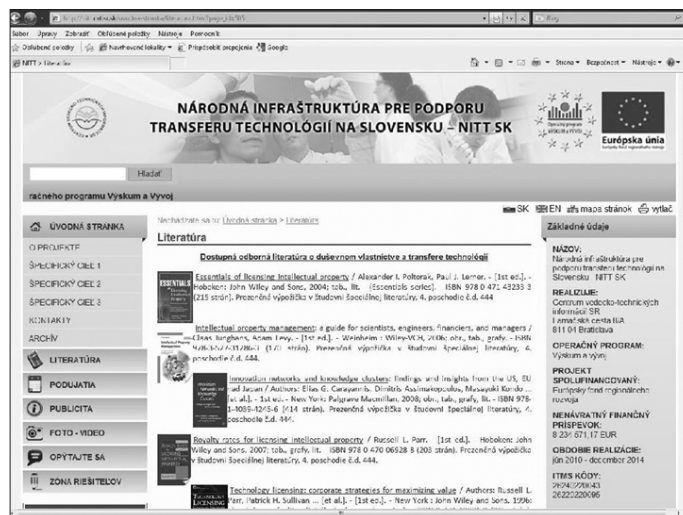
Obr. č 4 Portál NITT SK – sekcia Literatúra

Zoznam jednotlivých titulov môžete nájsť na webovej stránke CVTI SR v samostatnej sekcii NITT ( http://nitt.cvtisr.sk/uvodna-stranka/literatura.html?page_id=505 ) (obr. č. 4).