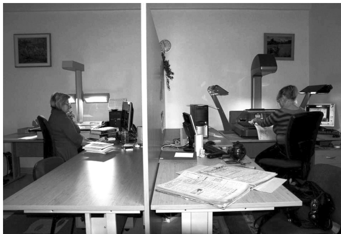
Obr. 3 Digitalizačné a reprografické centrum v ŠVK v Košiciach