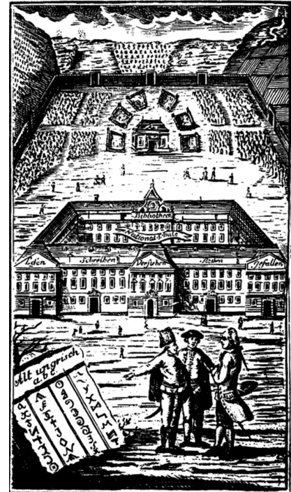
Wie glücklich ist ein deutscher Mann... Der unter Ungarn ungrisch kann...

Obrázok 1 BEL Matej: Meliböi ungarischer Sprachmeister: in einer ganz veränderten Gestalt. Mit einem neuen Anhang von den allernöthigsten Wörtern, Idiotismen, Sprüchwörtern, Gesprächen, Gedichten, ergötzenden Mannigfaltigkeiten vermehret. Itzt aber in der zwölf