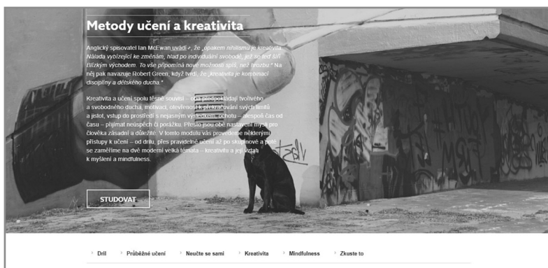
Ukázka struktury modulu – úvodní text, výběr kapitol i tlačítka pro lineární průchod kurzem.

V českém prostředí jde o téma, které je spojené především s Dagmar Chytkovou, která pro něj v roce 2010 vytvořila kurz, který až do letošního roku také obsahově garantovala a vedla. Její přínos v tomto tématu je ale širší. Nejen že ho akademicky etablovala a dokázala začlenit do kurikula, ale současně o něm dokázala popularizačně i odborně publikovat a téma formou workshopů, přednášek či projektů přenášela také do školního a knihovnického prostředí.