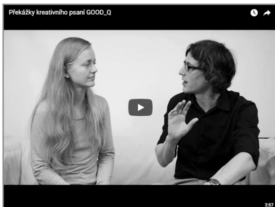
Video mají v kurzu roli povinných studijních materiálů a jsou tvořené dialogickou formou.

Má s ním stejný vizuální styl, informační architekturu i práci s obrazem. Dokonce jako ilustrativní využívá obrázky ze stejné fotobanky. Od ní také pochází idea vytvořit kurz, který bude otevřený a realizovaný formou webové stránky. Každý tak může přijít a obsah libovolně konzumovat.