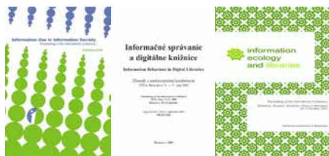
Obr. 2 Zborníky z medzinárodných konferencií organizovaných katedrou (2006, 2003, 2011)