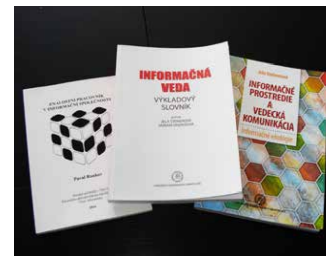
Obr. 1 Novšie publikácie autorov KKIV