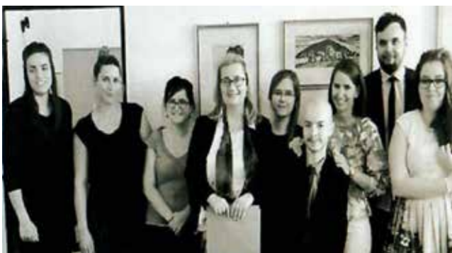
Obr. 12 Absolventi po štátnych skúškach