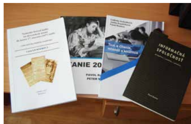
Obr. 8 Príklady vybraných publikácií autorov KKIV

Členovia katedry sú členmi redakčných rád významných medzinárodných časopisov v informačnej vede, ako napríklad Information Research , Mouaison , Open Information Science , Library Management , New Library , ale aj českých ( ProInFlow , Knihovna ) a slovenských odborných časopisov ( ITLib , Knižnica ) a. i.