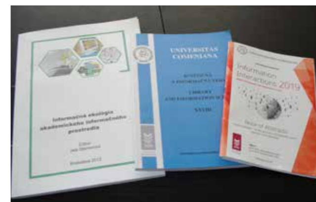
Obr. 10 Príklady vybraných publikácií autorov z katedry