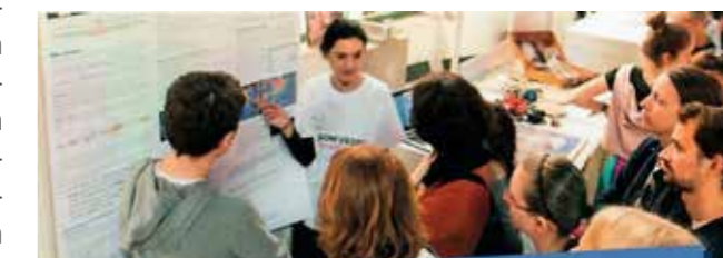
Obr. 11 Katedra na Noci výskumníkov

ného výskumu v informačnej vede, najmä v témach ako informačné správanie, informačná podpora vedeckej komunikácie, digitálna veda, informačná gramotnosť, čítanie, informačná etika. Katedra aj vo výskumoch úzko spolupracuje s praxou, najmä s väčšími knižnicami ako UKB, CVTI SR, ale aj NK SR, Mestská knižnica v Bratislave, Akademická knižnica FiFUK a iné knižnice na Slovensku, ako aj s odbornými spoločnosťami (SAK, SSK). Praktické témy záverečných prác aj praxe sú tiež často formulované v spolupráci so firmami zameranými na informačné a knižničné systémy (napríklad SVOP, Cosmotron, Albertina, a i.). Spolupráca s Akademickou knižnicou FiFUK poskytuje aj kurzy využívania informačných zdrojov pre študentov aj doktorandov, úspešný bol aj portál informačnej gramotnosti MIDAS ( https://midas.uniba.sk/ ). V odborných predmetoch pravidelne prednášajú odborníci z praxe, najmä z informačných inštitúcií, firiem aj médií. V spolupráci s praxou katedra zorganizovala mnoho zaujímavých podujatí, ako napríklad laboratórium čítania s využitím sledovania pohľadu (eye-trackingu) v rámci Noci výskumníkov alebo na veľtrhu Bibliotéka.