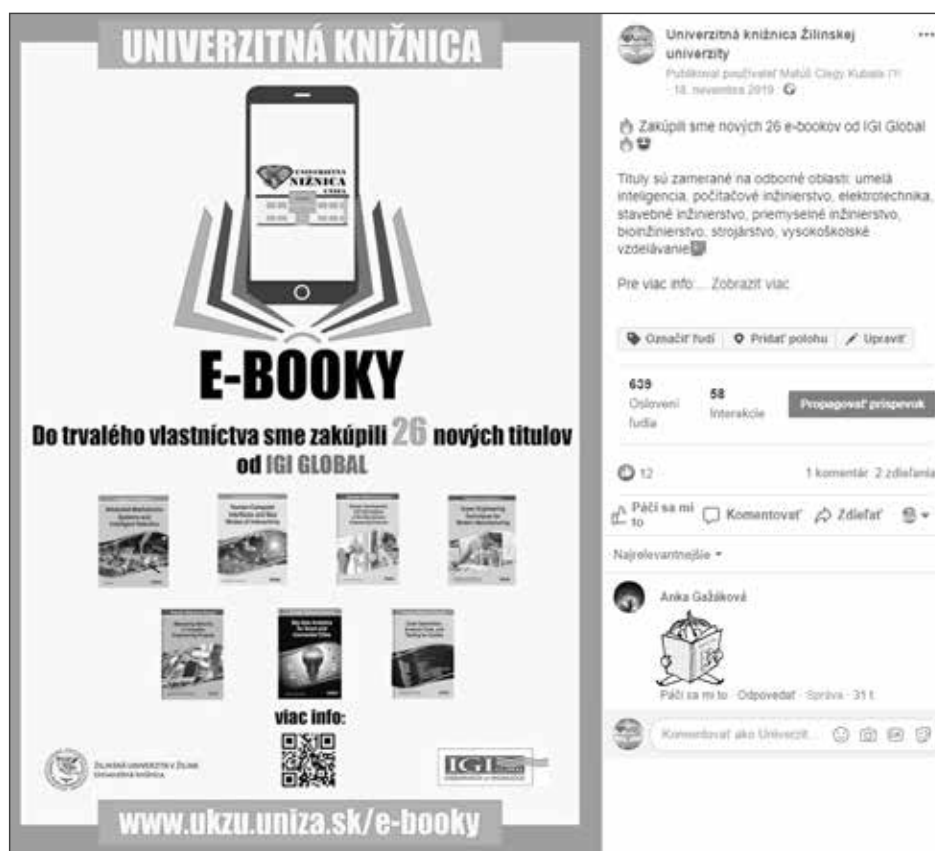
Obrázok 6 Kampaň na sociálnych sieťach pri zakúpených EIZ