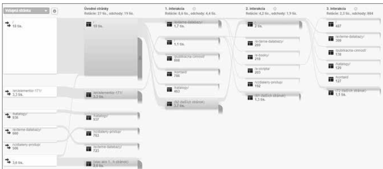
Obrázok 3 Tok správania sa používateľov na webovej stránke knižnice, prvý polrok 2020