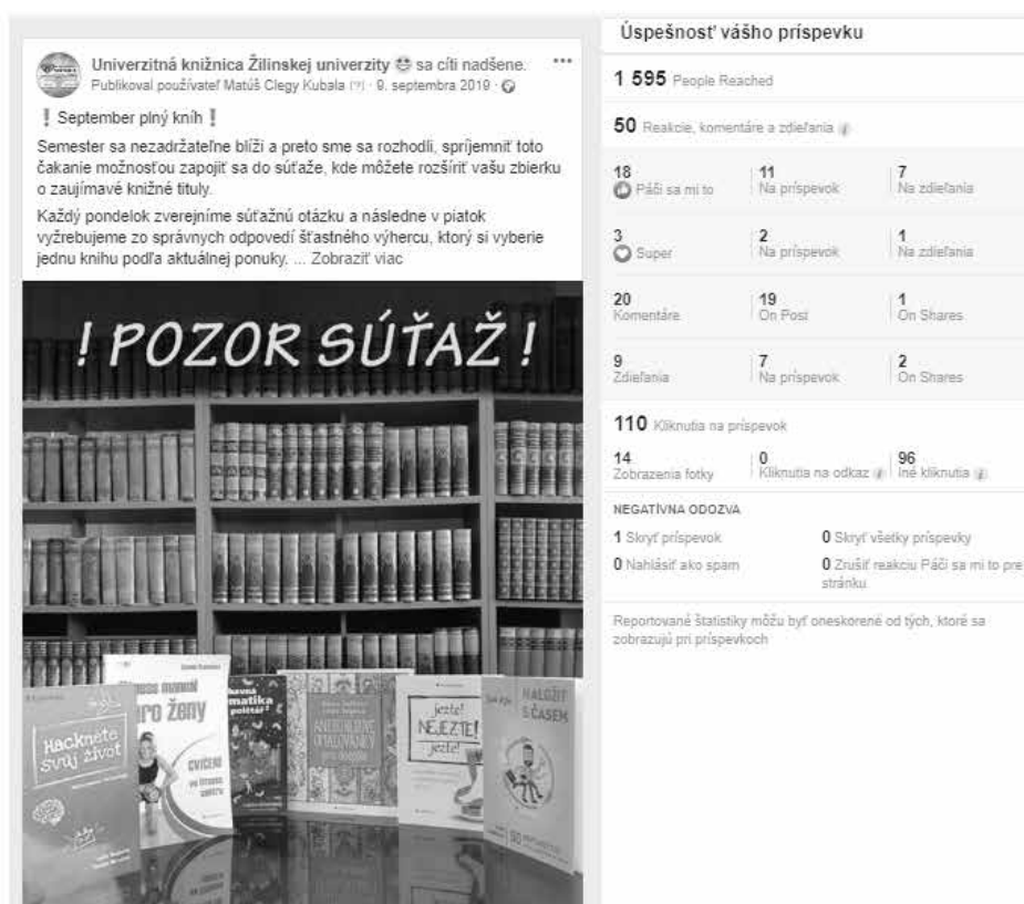
Obrázok 1 Príklad súťaže na sociálnych sieťach

UNIZA. Žilinská univerzita v Žiline patrí k popredným vzdelávacím a vedeckovýskumným inštitúciám na Slovensku. Študijné programy sa špecializujú prevažne na dopravu a technické odvetvia, ale aj na manažment, marketing či humanitné vedy. Má sedem fakúlt (prevádzky ekonomiky dopravy a spojov FPEDAS, stavebnú SvF, strojnícku SjF, elektrotechniky a informačných technológií FEIT, riadenia a informatiky FRI, bezpečnostného inžinierstva FBI, humanitných