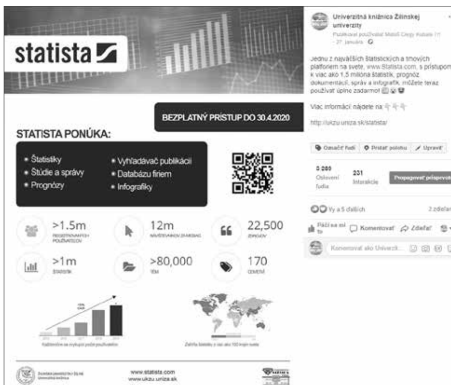
Obrázok 7 Kampaň na sociálnych sieťach pri TRIAL verzii EIZ

zdieľajú aj na FB stránke UNIZA. Pri EIZ zameraných na určitú vednú oblasť (napr. od IOP Publishing) sa v príspevku označujú (tag) relevantné katedry (prípadne celá fakulta), ktoré následne príspevok prezdieľajú.