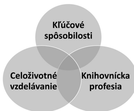
Obr. 1 Základná štruktúra integrovaného kontextu témy

S vymedzením kľúčových kompetencií v profesii knihovníka sa v knižničnej teórii a praxi stretávame už druhé decénium. Táto verejná odborná diskusia evokuje k úvahám, ktoré túto problematiku smerujú k prienikom troch integrovaných kontextov témy s vymedzením kľúčových spôsobilostí, otázok celoživotného vzdelávania (učenia) a knihovníckej profesie.